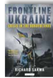
Richard Sakwa, Frontline Ukraine:

Twee experts van militaire raketten – beiden voormalige Oost-Duitse officieren – leggen in dit toegankelijke boekje uit wat de essentiële kenmerken zijn van een raketlancering: hoe is zo'n lancering te herkennen? Doordat bij de MH17-ramp deze kenmerken ontbreken, constateren ze dat het vliegtuig níét door een Bukraket kan zijn neergehaald. Andere scenario's moeten nu eindelijk worden onderzocht – Auf der Suche nach der Wahrheit.