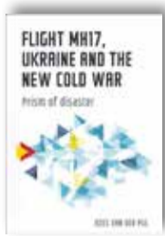
Kees van der Pijl, Flight MH17, Ukraine and the New Cold War