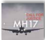
MH17 - Call for Justice