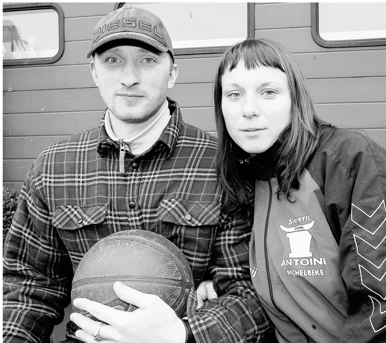
Doniks en Donika keren in mei terug naar Letland. «Of we nog naar België terugkomen, hangt af van Michelbeke en Zottegem. We hebben nog geen overeenkomst voor volgend jaar.»

Michelbeke (licht). Mijn favoriete plaatsje is op dit moment Blankenberge, maar ik heb Brussel of Antwerpen nog steeds niet gezien.